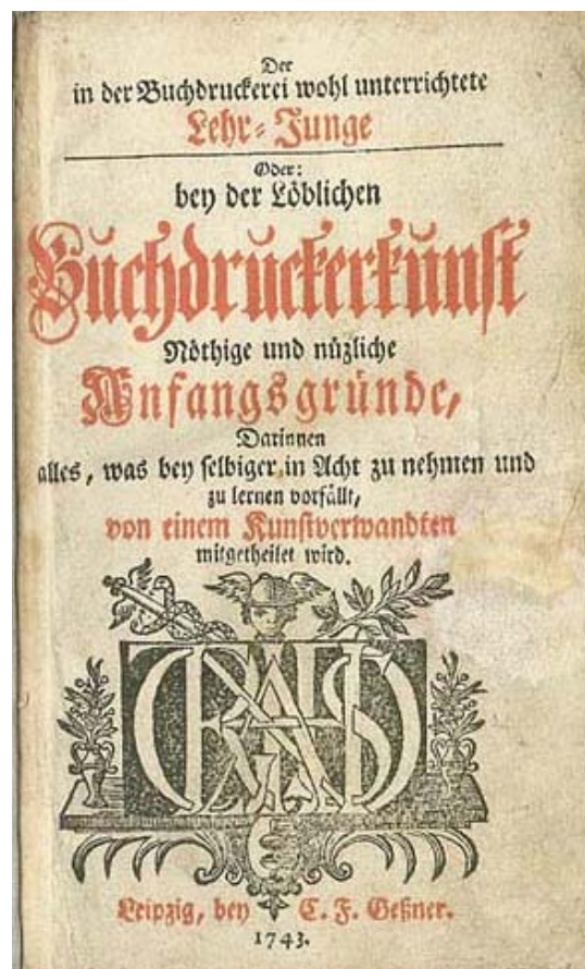
Technisch vakboek uit de collectie van de Historische Drukkerij.

Het programma voor Vlaanderen en Brussel is te vinden op www.erfgoeddag.be