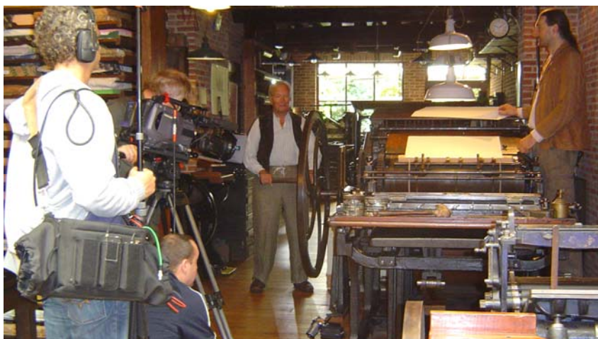
Opnames voor de documentaireserie in 19 de eeuwse kleding

De digitale cultuurzender Exqi ( http://www.cultuurzender.be ) blikte afgelopen maand een reportage in van de Historische Drukkerij voor hun dagelijks cultuurprogramma 'De verbeelding'. De leden van deze nieuwsbrief kregen bericht van de uitzending via mail. Jammer genoeg is digitale televisie nog niet alom tegenwoordig. Daarom was Exqi bereid een kopie van de reportage te bezorgen zodat u allen kan meegenieten van het acht minuten durende resultaat. Kijk hiervoor op de startpagina van de website van de Historische Drukkerij : http://www.historischedrukkerij.be