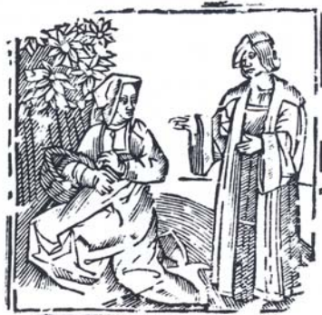
Deze afdruk van een drukblok vertelt het verhaal van Mariken van Nieumeghen.

In totaal werden bijna 200 drukblokken aangekocht. Een dertigtal hiervan is zeer oud, enkele dateren vermoedelijk zelfs van het einde van de zestiende eeuw! Speurwerk zal hierover hopelijk in de komende maanden uitsluitsel geven. Van enkele blokken werd de afbeelding al herkend. Die houtsnedes zijn terug te vinden in de verhalen 'Mariken van Nieumeghen' en 'Koningin Sibilla'. Deze volksboeken stammen uit het begin van de zestiende eeuw