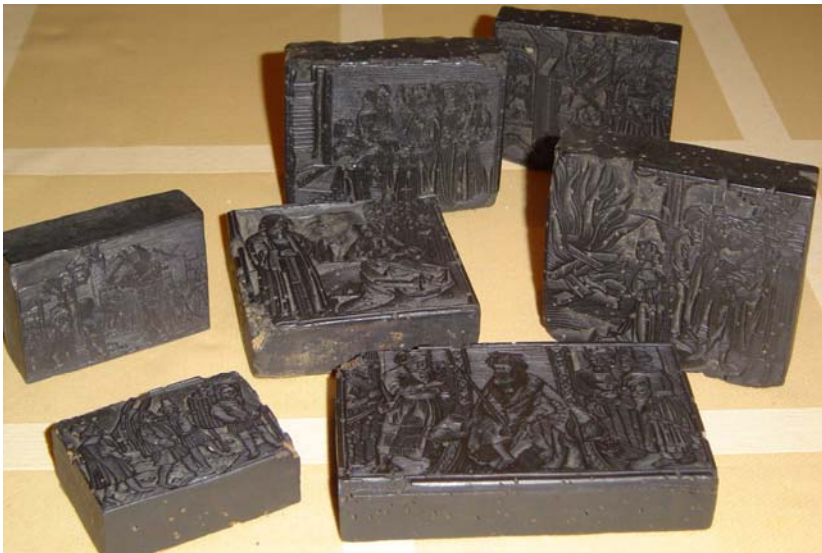
Enkele van de oudste houten drukblokken

Afgelopen maand kocht de Historische Drukkerij bij een Nederlands antiquair een partij houten drukblokken. Deze vondst heeft nog niet al haar geheimen prijsgegeven maar het ziet er naar uit dat minstens een deel ervan zeer - tot uiterst bijzonder zijn!