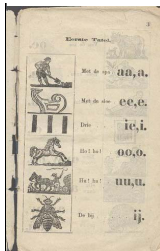
Links : afdruk van 32 houtsnedes uit de collectie van de Historische Drukkerij Rechts : een pagina uit het lesboek 'Eerste oefeningen in het lezen'.

Het volledige boekje is te zien via onderstaande link, een uitzonderlijk boeiende website over 'het oude kinderboek'.