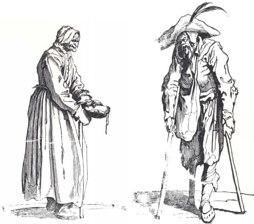
Boven : twee vermoedelijk negentiende-eeuwse houtblokken, formaat beiden telkens 15 x 9 cm.

De collectie wordt waardevoller naarmate de houtblokken geïdentificeerd kunnen worden en eventueel het drukwerk waarin deze afbeeldingen gebruikt zijn, ook tot de collectie behoort. Een interessante aanzet voor een nieuwe publicatie. Deze zoektocht is uiteraard een zeer moeilijke opdracht waarin alle hulp welkom is. In de komende weken plaatsen we de houtsnedes op de website ter identificatie. De houtblokken die vermeld werden in nieuwsbrief nummer 36 kan u nog steeds raadplegen via volgende link :