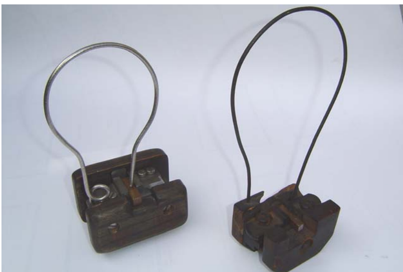
Links de Duits-Vlaamse replica, rechts het originele Franse letterhandgietapparaat

Originele letterhandgietapparaten zijn uiterst zeldzaam. Wereldwijd zijn er naar schatting nog een 600-tal overgebleven. Hiervan zitten veruit de meeste (278) in het Museum Plantin-Moretus (Antwerpen) en in het Johan Enschedémuseum in Nederland (121). Daarnaast zijn er verspreid over de wereld nog een 15-tal musea die één of meerdere handgietapparaten in de collectie hebben. Onbekend zijn de apparaten in privécollecties. Vele jaren bleef het een droom en waren we uiterst tevreden met de replica van een Duits gietapparaat dat door Sus Peinen in zijn atelier werd gemaakt. In mei 2008 werd het dan ook Object van de maand van TRAM 41. (zie bijlage) Vandaag is de Historische Drukkerij Turnhout de trotse eigenaar van een Frans gietapparaat vermoedelijk uit het einde van de achttiende of het begin van de negentiende eeuw. Van de instrumentenbouwer Bardou (Parijs) zijn voorlopig nog geen gegevens teruggevonden. Alle hulp hierbij is welkom!