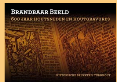
Bezoek de tentoonstelling !!