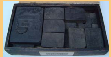
Het kistje met de houten drukblokken zoals deze aangekocht werd.