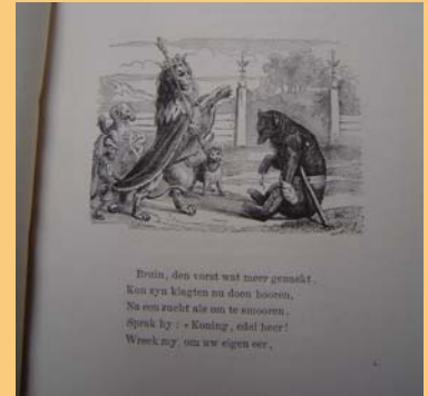
Een voorbeeld van een tekst-illustratie