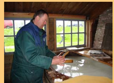
In de papiermolen, het handscheppen...