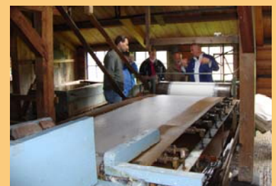
...En het papiermaken via de langzeefmachine. (in werking!)