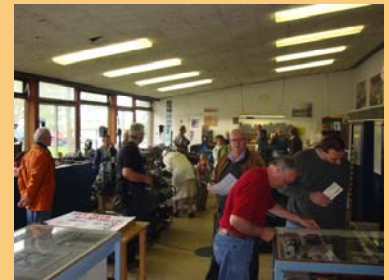
De Open dag van Stichting Lettergieten was een succes!