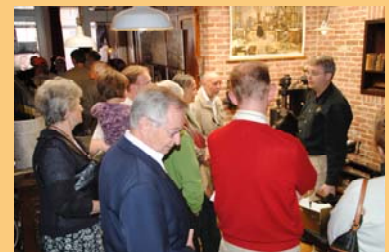
een ruime opkomst zorgde ervoor dat onze medewerkers de ganse dag druk in de weer waren met rondleidingen...