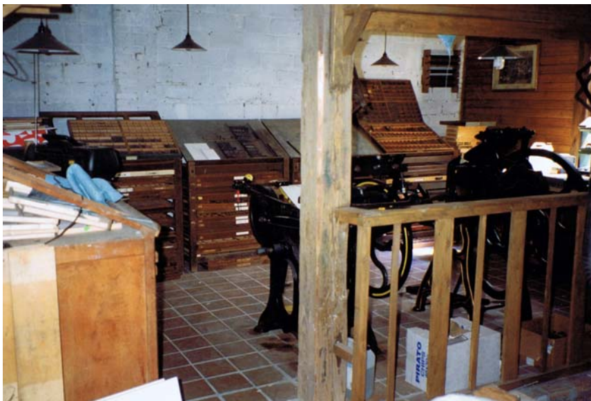
De ambachtelijke drukkerij kreeg de naam 't Sjaffelhuys . (afgeleid van het dialectwoord taffelen of sjaffelen wat betekent langzaam met klein werk bezig zijn)

1996. Twee arbeiderswoningen aan de Steenweg op Mol worden aangekocht. In de achterliggende schuur wordt de zandgrond vervangen door een betegelde vloer. Een vals plafond zorgt ervoor dat de ruimte geïsoleerd kan worden. Boekbinden, papierscheppen en ambachtelijk drukken gaan van start. Met twee trapdegelpersjes en enkele letterkasten werd op het eigenhandig geschept papier allerlei klein drukwerk verzorgd voor vrienden.