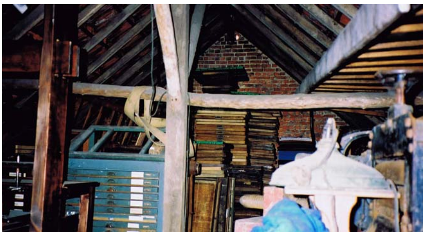
Maar het valse plafond werd al snel opslagruimte, het verder verzamelen van grafische materialen sloop langzaam binnen...