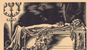
Houtgravure van Nelly Degouy in 'De drie zustersteden', door C. Ledeganck, een uitgave van de Nederlandsche Boekhandel, 1941.

Info: 03 760 37 50 stedelijke.musea@sint-niklaas.be